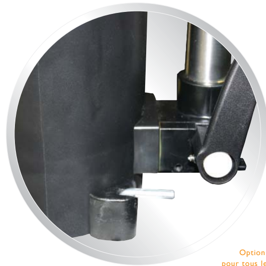
DECLANCHE RAPIDE Option de réservoirs amovibles pour tous les modèles de 2.5 Quart.